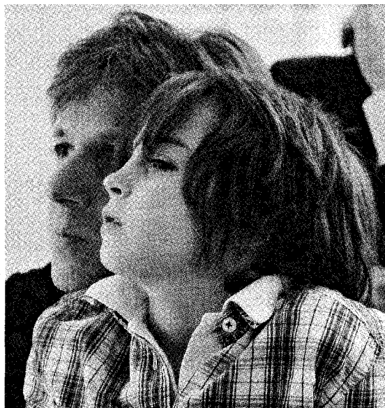
Grandi e piccoli hanno risposto sabato all'appello di ReggioNarra quest'anno dedicato all'ascolto; sopra, due momenti nella «casa» dei frati cappuccini e lo spettacolo rappresentato allo Spazio Gerra